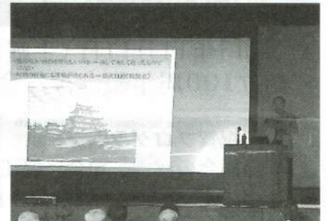
記念講演 / 中井 均