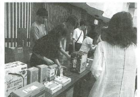
抽選会 / 景品